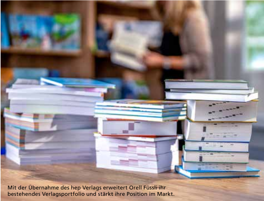
Mit der Übernahme des hep Verlags erweitert Orell Füssli ihr bestehendes Verlagsportfolio und stärkt ihre Position im Markt.