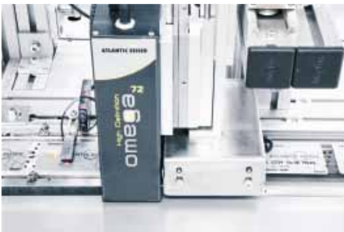
OMEGA 72i Das DoD-Druckmodul (Drop on Demand) ermöglicht ein Höchstmass an Flexibilität und Qualität beim schnellen Bedrucken diverser Substrate. Visa® und MasterCard® erlauben dieses Verfahren zur Personalisierung flacher Finanzkarten.

Weil jedoch ein Grossteil der Artikel, Verpackungen und Etiketten an ihrer Oberfläche sehr glatt oder chemisch vorbehandelt sind, kann der aus dem Büro-Dokumentenbereich bekannte Digitaldruck meistens nicht genutzt werden. Hier setzt Atlantic Zeiser mit seiner Inkjet-Drucktechnologie und der Ausrichtung auf spezifische Anwendungen ein. Um den wachsenden Sicherheitsbedürfnissen der Kunden, z.B. in der pharmazeutischen Produktion oder beim Kampf gegen Produktpiraterie, mit Angeboten aus einer Hand nachkommen zu können, setzt Atlantic Zeiser vermehrt Sicherheitsfunktionen ein, die sich bei Lösungen für das staatliche Umfeld bewährt haben.