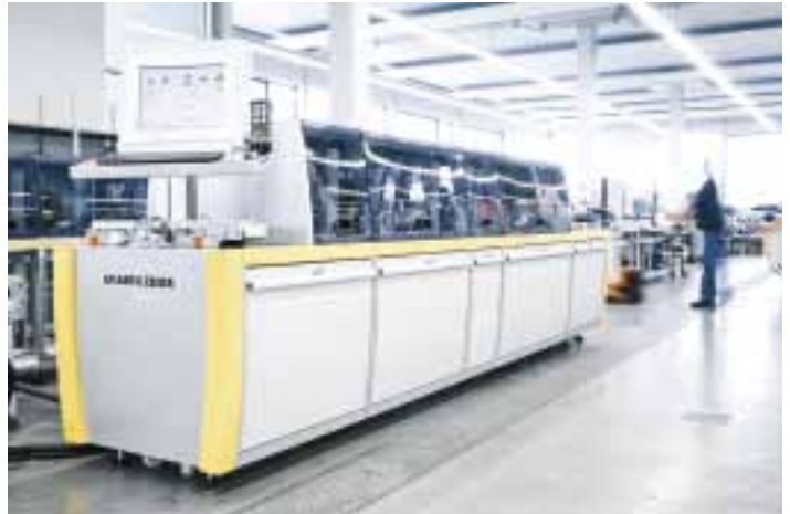
PERSOLINE personalisiert ID-, Finanz- und SIM-Karten mit höchster Geschwindigkeit und Sicherheit dank neuester Inkjet-Technologie von Atlantic Zeiser. Damit lassen sich die Personalisierungskosten pro Karte um bis zu 90% senken.

Um die Vorreiterstellung weiter auszubauen, entwickelt Atlantic Zeiser sämtliche Basistechnologien im eigenen Haus. Dazu gehören Drucker-Hardware inklusive Steuerungssoftware, Tintenchemie, Tintentrocknung, Qualitätsüberwachung und Workflow-Software. Auf diese Weise gewährleistet Atlantic Zeiser auch in Zukunft für die Kunden ein hohes Mass an Qualität, Benutzerfreundlichkeit, Einsatzflexibilität, Wirtschaftlichkeit, Datensicherheit und Robustheit.